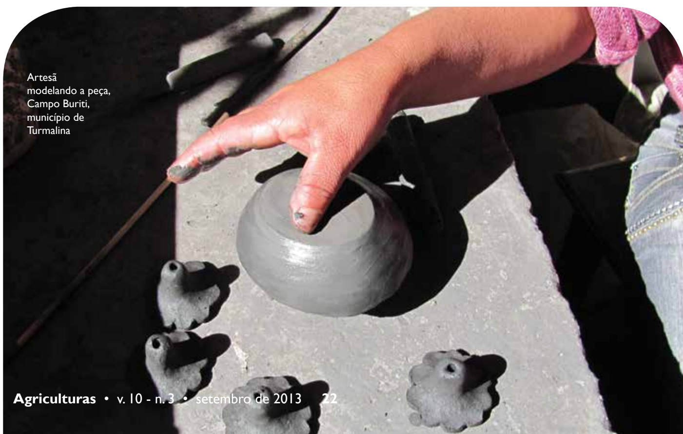
Artesã modelando a peça, Campo Buriti, município de Turmalina

Instrumentos e técnicas costumeiras foram sendo assim atualizados, experimentados e aperfeiçoados para que novas possibilidades de pintura fossem desenvolvidas, principalmente para que a precisão, as paletas de cores e a durabilidade dos pigmentos criassem novas alternativas de acabamento. Essa experimentação foi feita sem o uso de tintas químicas ou novos equipamentos. Ao contrário, foram inovadas a partir do repertório de conhecimento ambiental dominado pelas comunidades: conhecimento sobre a base de recursos, sobre as técnicas agrícolas, sobre as possibilidades de recursos da natureza produzirem e fixarem os pigmentos e sobre a diversidade do barro, sua resistência ao fogo e aceitação da pintura.