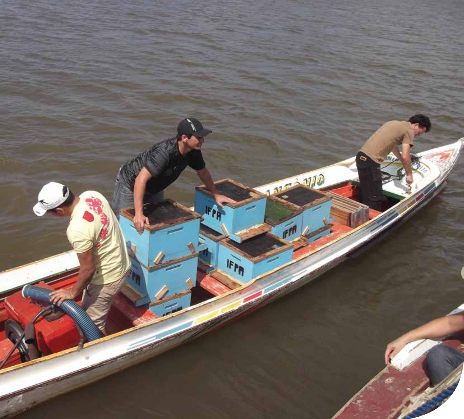
Transporte de caixas de abelhas para a Ilha do Capim, Abaetetuba

de experimentação local, rompendo a lógica de hierarquização na produção do conhecimento científico.