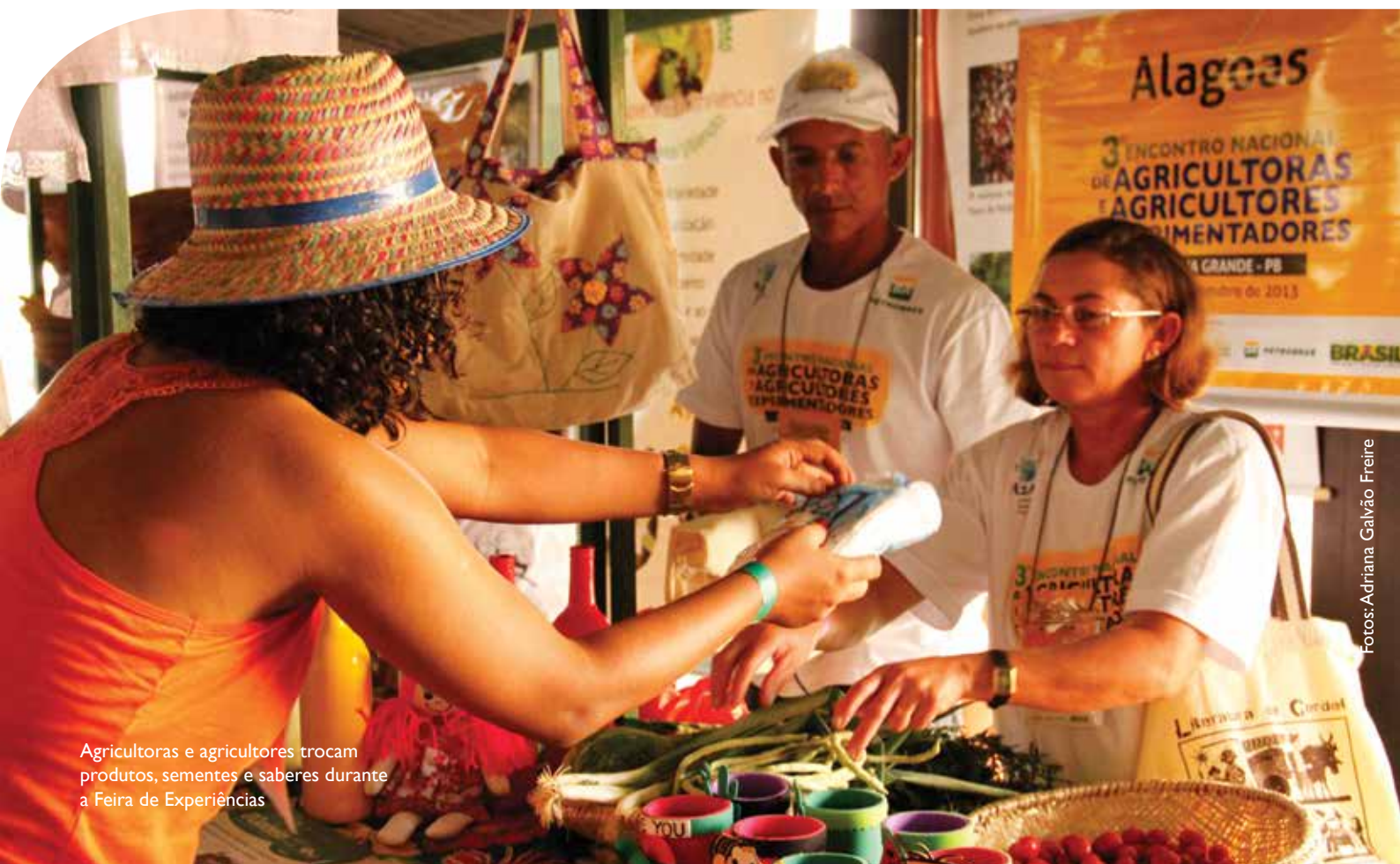
Agricultoras e agricultores trocam produtos, sementes e saberes durante a Feira de Experiências