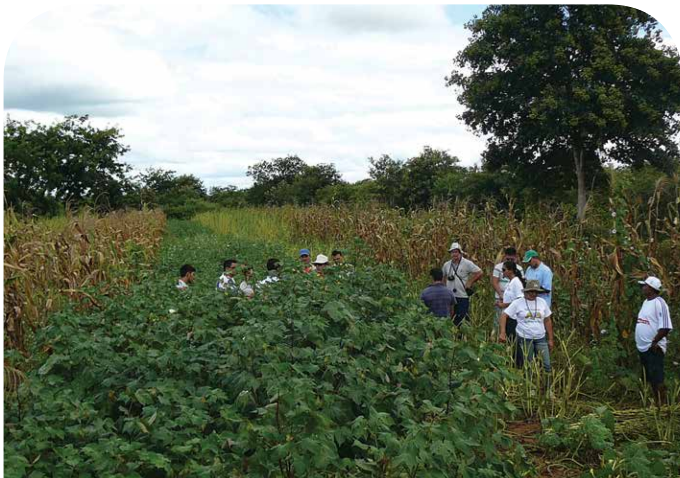
Módulo de formação em campo sobre manejo e convivência com os insetos-praga