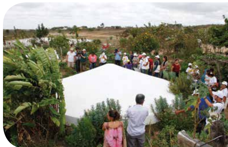
Troca de conhecimentos durante visitas de intercâmbio