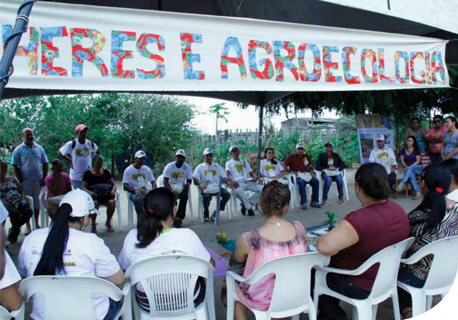
Mulheres agricultoras debatem sobre seu papel no fortalecimento da agricultura familiar

res(as)-experimentadores(as) também provocam profundas mudanças no seio das organizações de apoio e, em particular, de assessoria técnica e pesquisa.