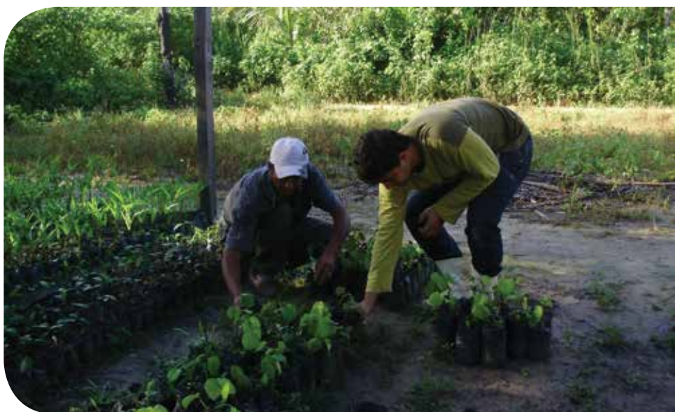
Agricultores e educandos no trabalho em atividade do Estágio Supervisionado