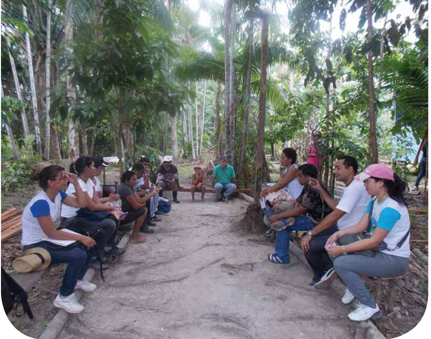
Aula prática com a participação de agricultores, educandos e educadores em São Domingos do Capim

Em relação aos cursos, identificam-se vários de nível médio, superior e de pós-graduação em diversas áreas das Ciências Agrárias com ênfase ou habilitação em Agroecologia. Existem também núcleos de extensão e pesquisa em Agroecologia institucionalizados a partir de editais do CNPq, bem como grupos de Agroecologia, agricultura ecológica, agrofloresta, entre outros, organizados por estudantes de diferentes cursos de várias universidades e institutos no país.