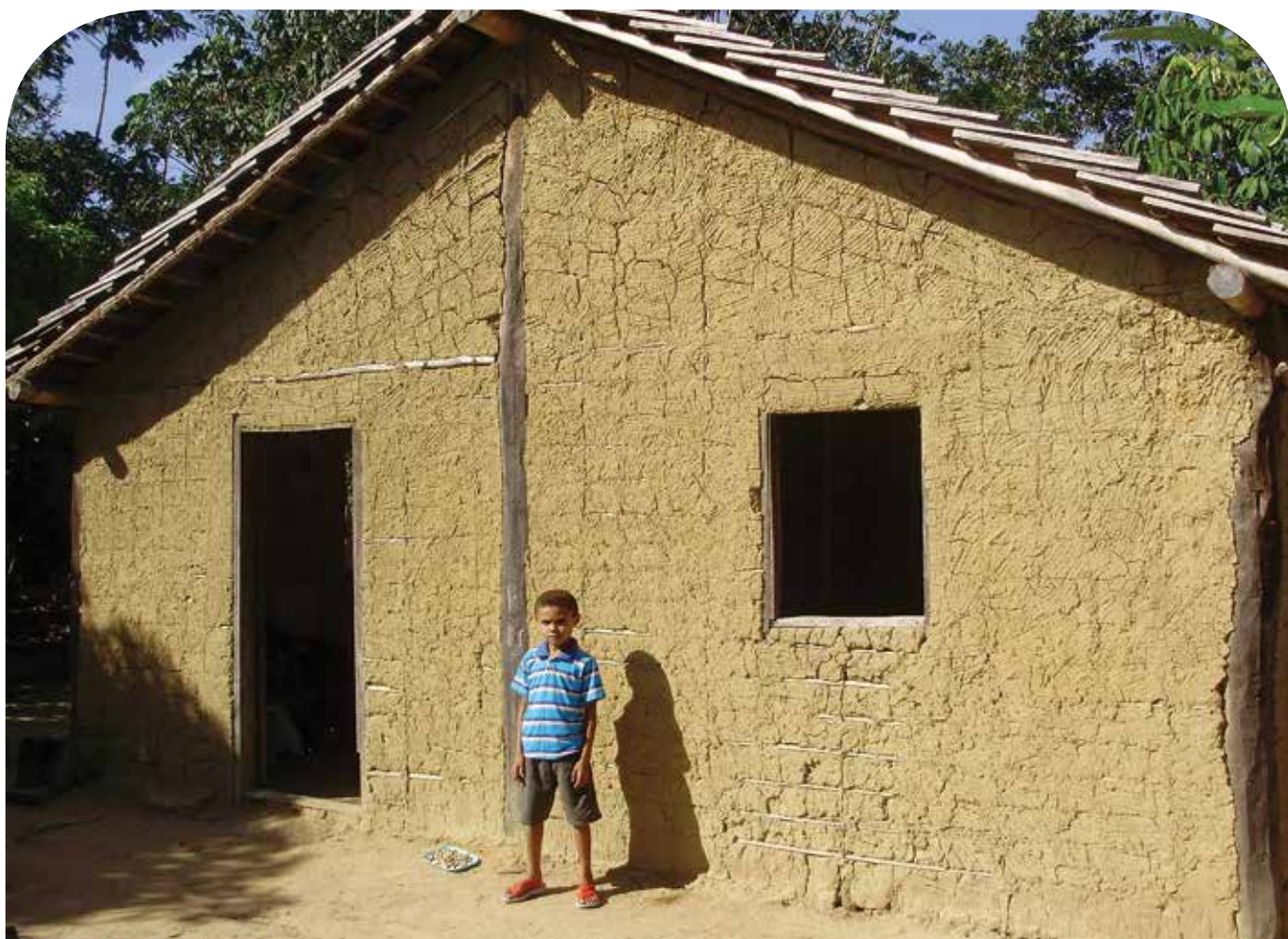
Casa de família que acolhe atividades do estágio supervisionado

Do ponto de vista metodológico, tem-se adotado a implantação de Unidades de Pesquisa Pedagógicas de Experimentação Agroecológica (Upeas) como espaços físicos de ensino–pesquisa–extensão concebidos com a finalidade de apoiar a diversificação produtiva e estimular o desenvolvimento de inovações tecnológicas contextualizadas à realidade. Uma das características mais expressivas dessas atividades é a busca constante pelo estabelecimento de diálogo e articulação entre os conhecimentos dos educadores, educandos e agricultores envolvidos em dinâmicas