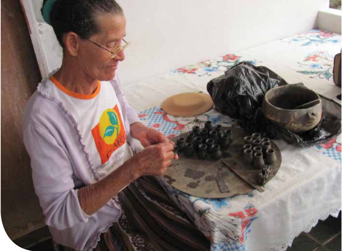
Detalhe do processo de produção do artesanato em barro

Essas inovações têm origem na técnica, mas são também construções sociais, pois passam por canais específicos de transmissão de saberes. E, nessa circulação de conhecimentos, a lógica de uso dos recursos naturais trava o conhecimento ao meio, estimula a inventividade, o intercâmbio, as redes locais e o sentimento de pertencimento ao grupo.