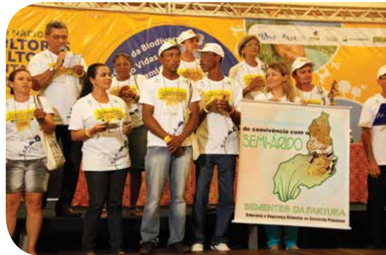
Na abertura do Encontro, caravanas vindas de todos os estados do Semiárido partilham sua cultura e suas expectativas