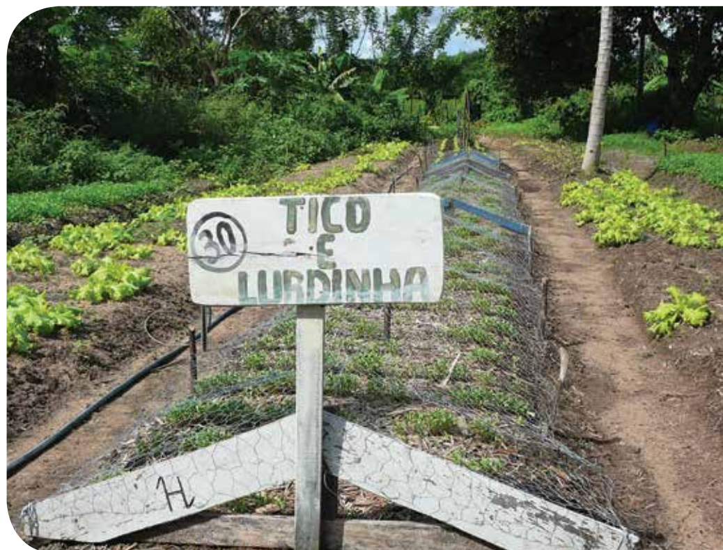
Experimentação no cultivo ecológico de hortaliças e pomares

Para dar concretude aos conceitos, estratégias e premissas mencionados, a assessoria técnica às famílias foi organizada a partir de um arranjo de abrangência territorial (Figura 1), que buscou estruturar um sistema coerente de planejamento, execução e avaliação das ações a partir da integração das equipes técnicas com as famílias. O foco dessa integração foi a troca de conhecimentos que contemplassem as necessidades apresentadas pelas famílias. Esse arranjo foi estratégico para que houvesse articulações entre as famílias, suas organizações representativas e movimentos sociais em uma busca permanente por acesso a políticas públicas e projetos que fortalecessem as ações em curso, desde o âmbito comunitário até o territorial.