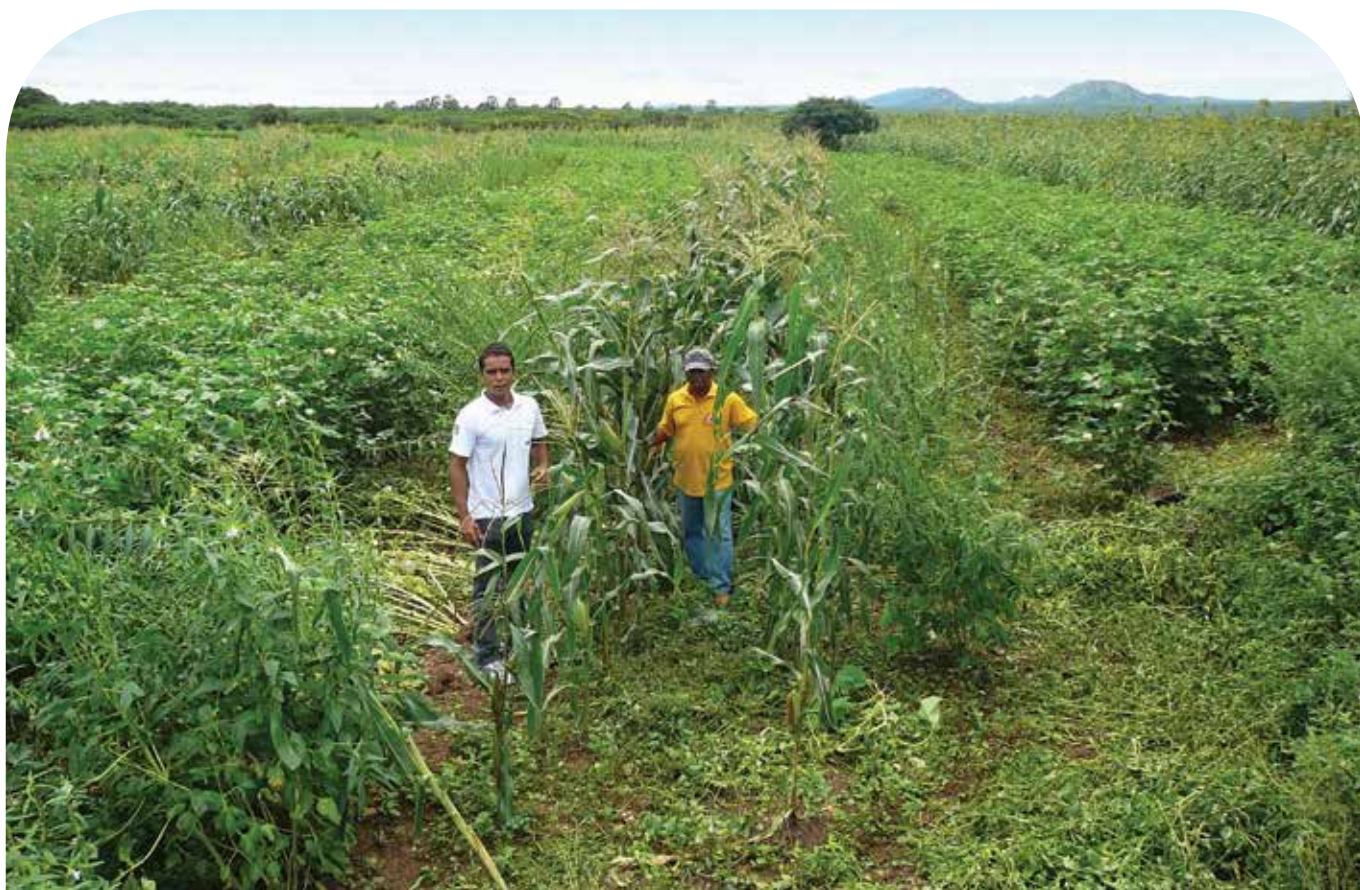
Algodão em consórcios agroecológicos

Para o PDHC, as atividades de assessoria técnica devem ser planejadas, desenhadas, implementadas e avaliadas de forma participativa, junto com os principais interessados/beneficiários. Essa abordagem busca inverter a lógica de Ater convencional, fazendo com que a assessoria deixe de ser movida pela oferta de inovações e passe a ser mais orientada pela demanda vinda da realidade das famílias agricultoras. Quando se inicia um trabalho em uma comunidade ou assentamento, o primeiro passo é a realização de um Diagnóstico Rápido e Participativo (DRP). A partir dele, deve-se construir um plano de trabalho para o primeiro ano. Nos anos subsequentes, renova-se o processo de planejamento, com a elaboração de novos planos de trabalho, que passam a fazer parte dos contratos entre o PDHC e as parceiras de Ater (SIDERSKY; JALFIM; RUFINO, 2010). Esse processo promoveu uma dinâmica educativa recíproca, com base no diálogo, na transparência, na