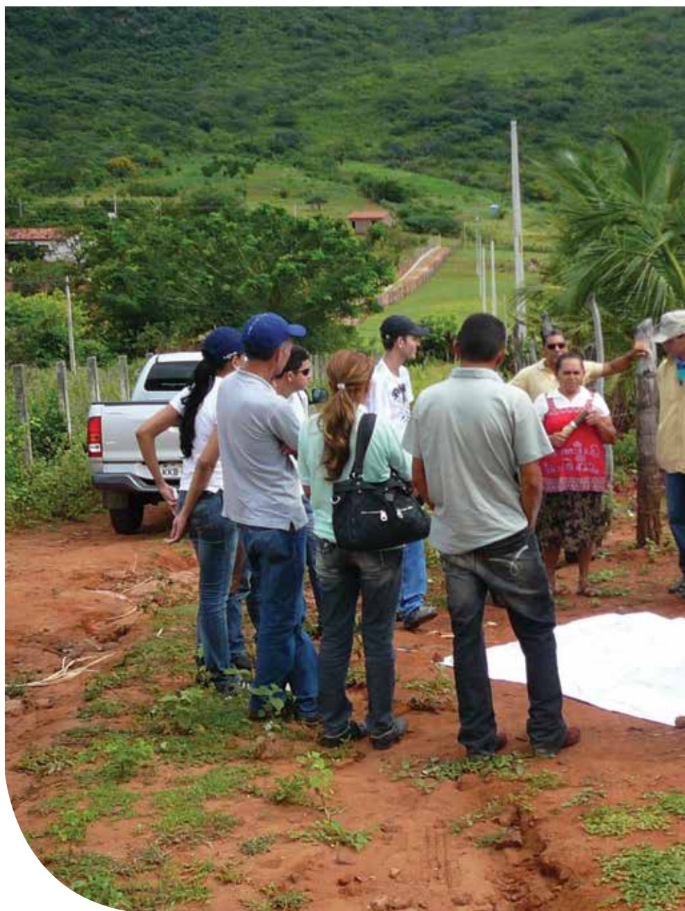
Planejamento ambiental e produtivo de agroecossistemas

Para melhorar o desempenho da lavoura ou da criação, resolver um problema ou desenvolver novas atividades produtivas, frequentemente é preciso contar com ideias, informações e conhecimentos novos. Nesse sentido, a visita de intercâmbio tem se mostrado um instrumento bastante útil. Trata-se de organizar o deslocamento de um grupo de agricultores para visitar um agricultor ou outro grupo (comunidade, assentamento, associação, etc.). As-