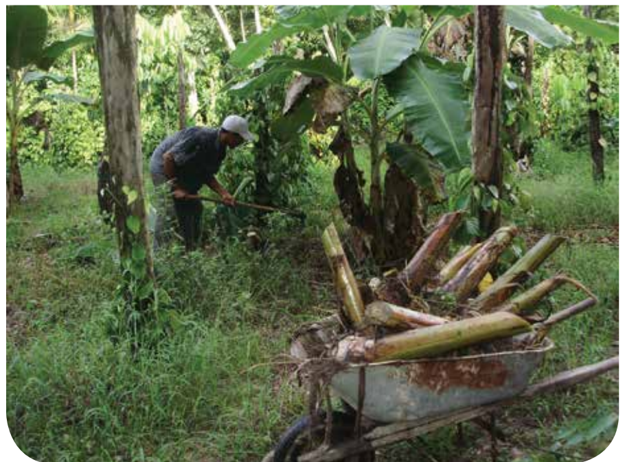
Plantio de mudas em esbalecimento familiar

Por fim, o desafio se refere à falta de compatibilidade entre a duração dos períodos letivos e o tempo necessário para que os trabalhos de extensão produzam resultados, uma vez que a maior parte deles está atrelada a processos de desenvolvimento comunitários de longo prazo que exigem uma constância das atividades. Porém, muito por conta da dinâmica dos cursos e da própria instituição, essas atividades de extensão têm dificuldades de se estabelecer de maneira mais continuada. Ademais, os próprios projetos, tanto de extensão rural como aqueles de extensão universitária financiados por instituições públicas, têm curta duração, sendo dificilmente renovados para períodos subsequentes, o que também não permite ações continuadas de média ou longa duração.