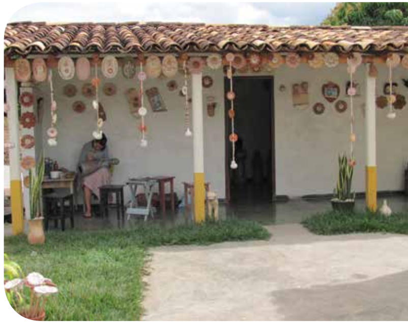
Casa da artesã Zezinha, comunidade de Campo Buriti, município de Turmalina

Descrito dessa forma, o processo parece simples, mas enfeixa uma série de procedimentos, técnicas e conhecimentos, alguns muito refinados, principalmente o oleio . Oleiar significa