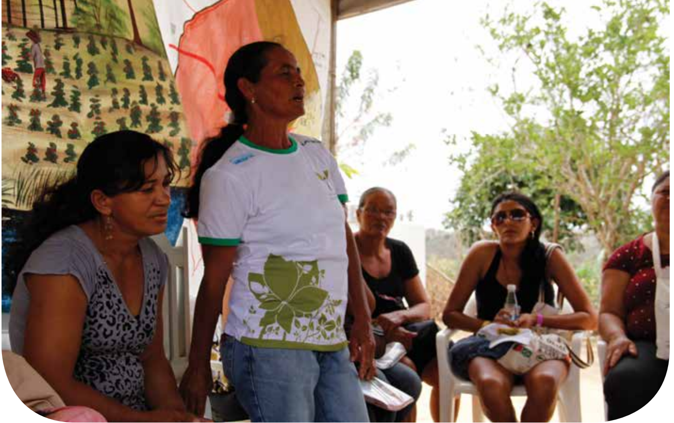
Agricultoras-experimentadoras desvelando a importância do trabalho manual e intelectual das mulheres

blicas mais adaptadas à realidade da agricultura familiar e do semiárido. Nessa metodologia, constrói-se, portanto, um novo papel para os técnicos, que vai na contracorrente da lógica difusionista do modelo clássico de extensão, no qual o conhecimento chega pronto, baseado em receitas e pacotes tecnológicos generalizantes.