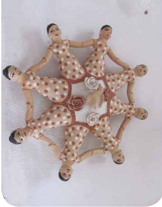
Mandala de lavradoras, comunidade de Campo Alegre, município de Turmalina

A lenha é matéria-prima importante para a terminação da peça. Sua aquisição reflete um firme conhecimento costumeiro sobre como alcançar a temperatura ideal para a queima das peças. As lenhas são classificadas como fortes ou fracas: é forte aquela de combustão intensa e demorada, usada pelas artesãs em menor quantidade. Elas vão dosando e combinando com a lenha mais fraca, tendo muito cuidado, uma vez que a peça pode entortar se a temperatura for muito elevada. As madeiras de lenha forte são o araçá e o pau d'óleo . Já as madeiras cujas lenhas dão fogo fraco, melhores para a queima, são a laranjeira e a bananinha , ambas nativas. Essa madeira fraca é usada no primeiro momento da queima, o caldeamento , quando as peças são colocadas em um fogo bem baixo para se acostumar com o calor, pois o calor excessivo estoura o barro. As peças ficam de quatro a seis horas em fogo brando para irem esquentando devagar, e, aos poucos é adicionada a lenha mais forte.