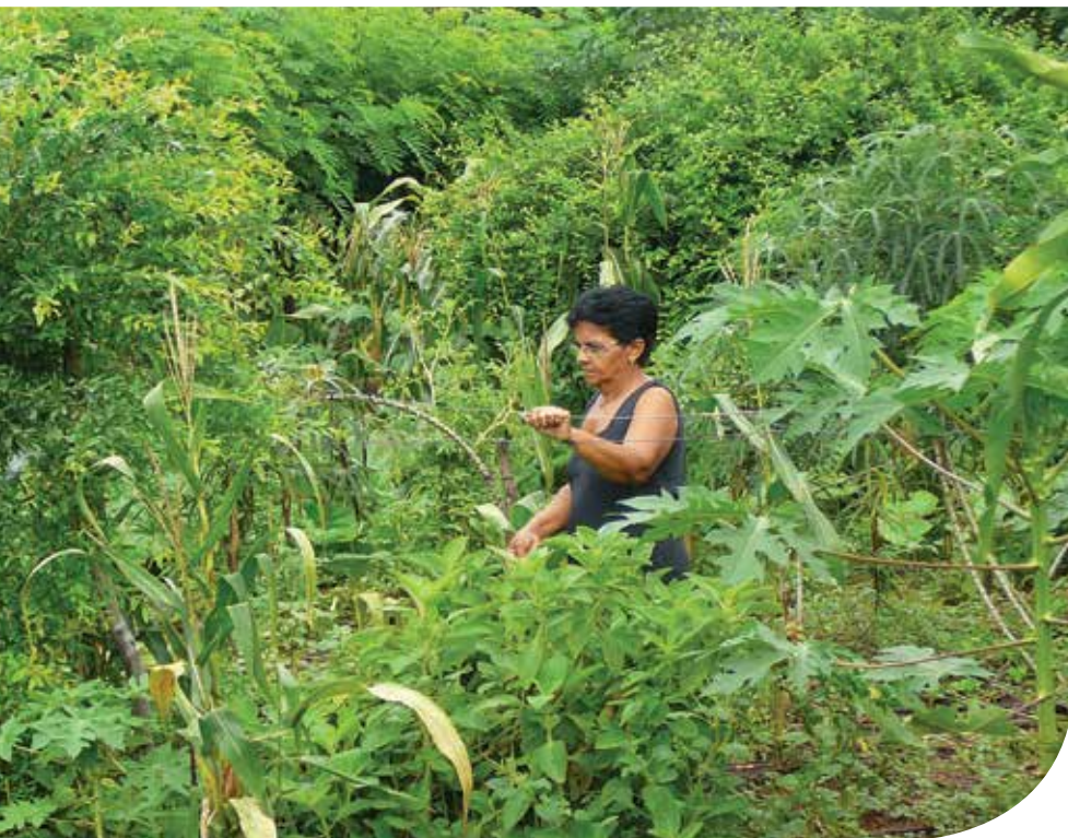
Cultivando a agrobiodiversidade em quintal produtivo

cultores de identificar problemas, formular hipóteses, realizar testes e analisar os resultados encontrados em seus experimentos. É esse roteiro que cria condições propícias para uma geração participativa de conhecimento que alimente e estimule a iniciativa das famílias agricultoras. O enfoque metodológico aqui mencionado foi