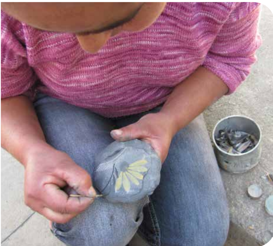
Artesãs de Campo Buriti, município de Turmalina

Este artigo descreve como essas camponesas afirmam seus saberes e de que formas construíram inovações organizativas e produtivas a partir do conhecimento tradicional . O objetivo é refletir sobre o saber vinculado à natu-