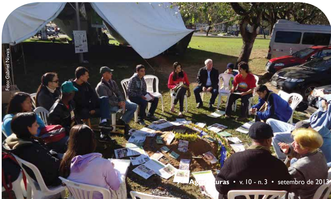
Instalação Pedagógica com o tema Legislação Ambiental, Troca de Saberes 2012

Os Círculos de Culturas são legados deixados por Paulo Freire e se caracterizam por reunir pressupostos filosóficos, teóricos e metodológicos para mobilizar os participantes do grupo a pensar sobre sua realidade dentro de uma concepção de reflexão-ação. Em 2010, o Círculo constituiu um momento de confraternização de diferentes manifestações culturais que