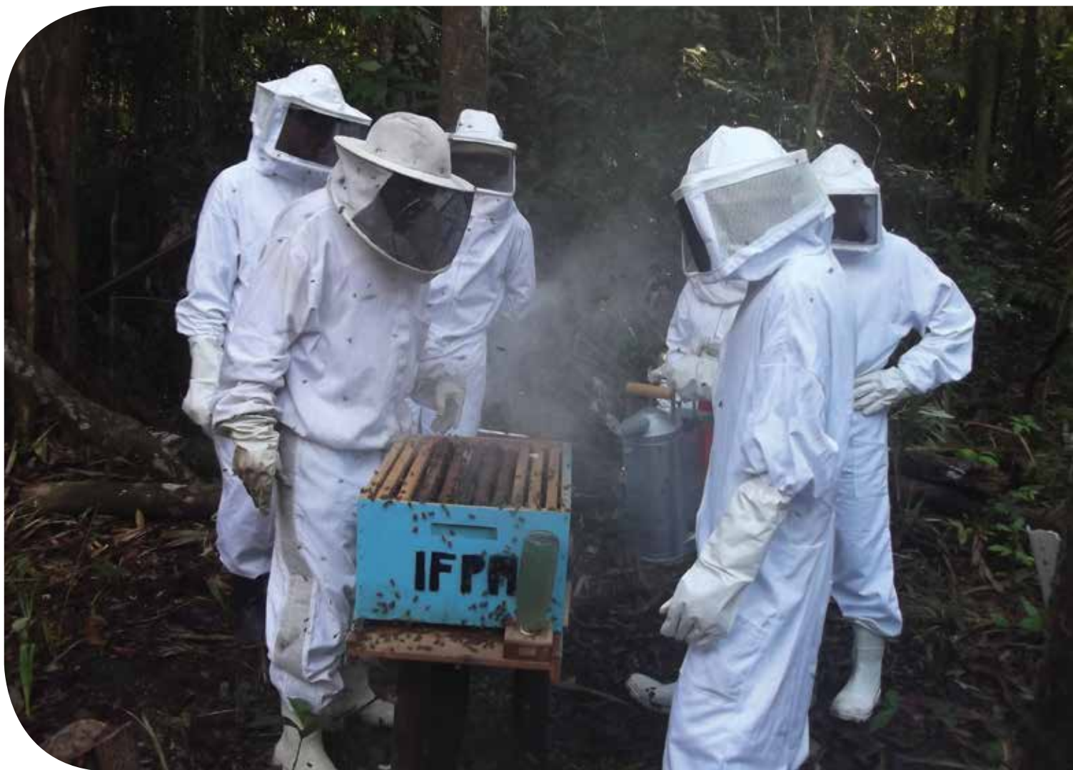
Instalação de apicultura na UPEA