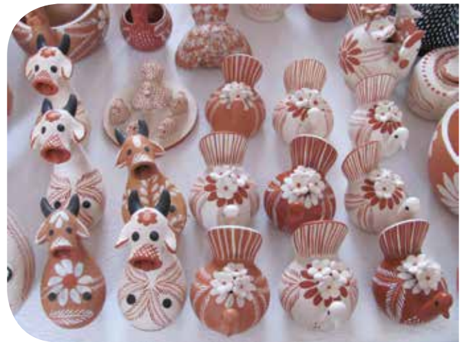
Bonecas na Associação de Lavradores e Artesãs de Campo Alegre, município de Turmalina

Produzir uma peça em barro é um ato solitário: cada artesã com seus equipamentos, suas matérias-primas, sua inspiração. Entretanto, os gargalos da comercialização das peças são enfrentados coletivamente pelas artesãs, que ao longo das suas trajetórias foram lidando com as dificuldades e experimentando e construindo canais de venda. São canais locais, regionais, estaduais, nacionais e até internacionais, que se articulam com as redes de apoiadores. Cada canal traz suas dificuldades e po-