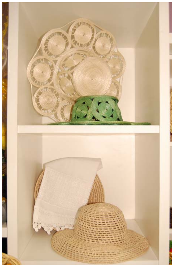
Artesanato produzido por grupos de mulheres

prolongada. A combinação desses fatores explica por que cerca de dois terços dos pobres rurais brasileiros se encontram nessa região.