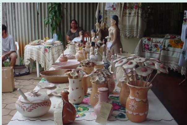
Feira de produtos do artesanato do Jequitinhonha