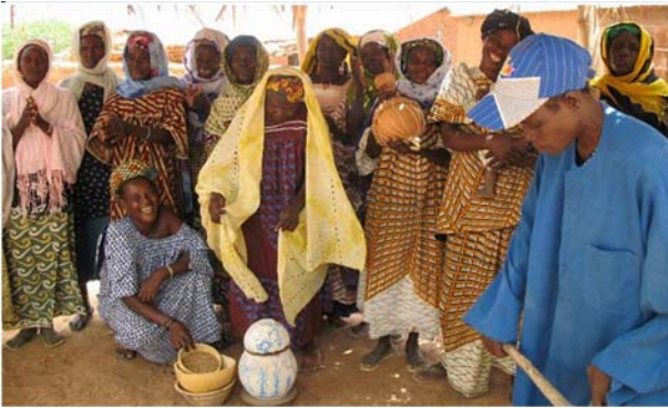
Mulheres de Zamblara cantam música que compuseram sobre as novas tecnologias para o arroz