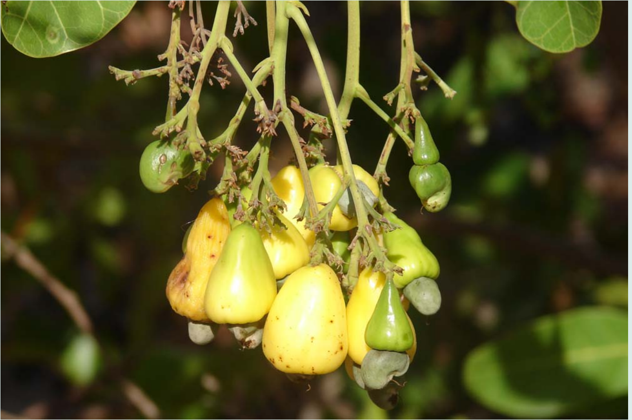
Cajuí, o caju do Cerrado, fruto coletado e beneficiado por muitas associações de agricultores

pações criadas, renda adicionada, mais valor agregado. Ocorre, porém, que populações rurais engajadas nessas experiências associativas nem sempre priorizaram apenas resultados materiais. Foram além da aspiração de ganhos em dinheiro e, para desespero de alguns avaliadores, muitas vezes privilegiaram outros benefícios, como o aumento da autoestima do grupo, o acesso à capacitação, a participação na política, o engajamento de mulheres em novas atividades não-domésticas e a abertura de novas redes de contato social.