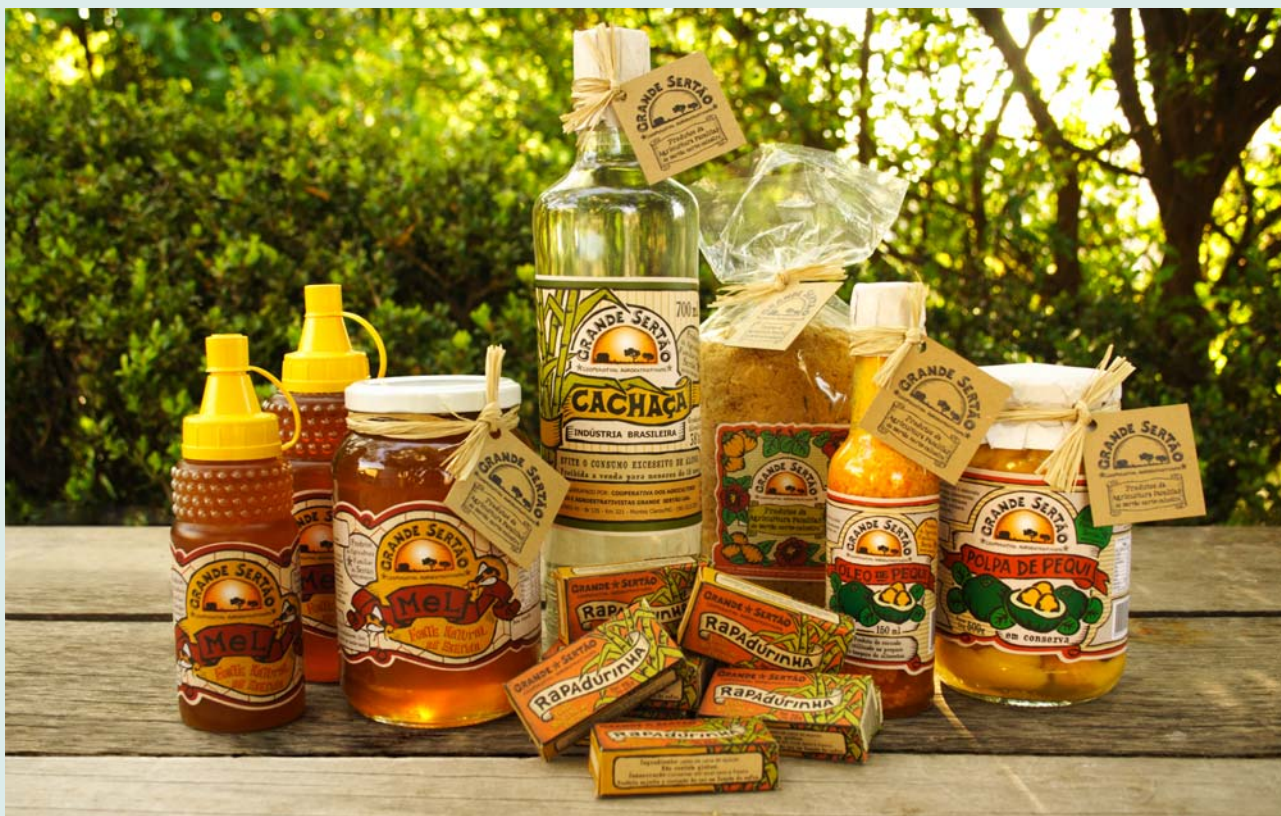
Produtos da Cooperativa Grande Sertão: polpas congeladas, mel, pequi, cachaça, rapadurinha

micos e de origem duvidosa, revertendo gradativamente o consumo de açúcar cristal, refrigerantes, suco em pó e óleo de soja por rapadura, mel, suco natural de frutas, polpa e óleo de pequi.