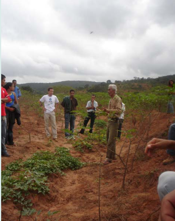
Visita técnica de agricultores à lavoura comunitária