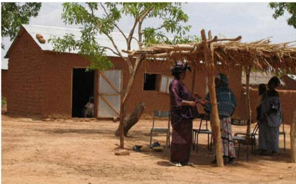
Com o sucesso das atividades do grupo, as diferenças sociais deixaram de ser importantes. Aqui, mulheres conversam em frente à casa que construíram.

nero ou casta. Os encontros semanais do Plar proporcionaram um maior contato entre os moradores da vila, especialmente entre mulheres de diferentes origens. O distanciamento entre as duas castas foi extinto. As mulheres estão unidas de tal forma que chegaram a construir uma pequena casa de encontros. Elas mesmas a construíram com materiais adquiridos com o dinheiro gerado pelo trabalho na área coletiva. Com toda essa evolução, as mulheres se sentem menos solitárias e isoladas. Como uma delas disse: “As pessoas das castas altas e baixas são as mesmas desde o Plar.” Com o projeto Pads e a implementação da abordagem Plar, essa estigmatização foi rompida e a união entre as pessoas foi fortalecida.