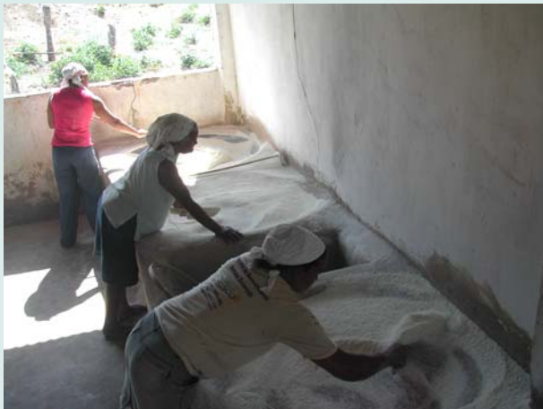
Beneficiamento de farinha em Minas Novas

mentos do Noroeste de Minas Gerais a partir de demandas que lhe são propostas, delimitando seu público-alvo dentro de especificidades sociais e religiosas. A Armicopa é uma federação que envolve 12 associações locais ou micro-territoriais de sete municípios dos Vales do Mucuri e do Jequitinhonha e atua por meio das organizações comunitárias que compõem sua base, todas relacionadas à agricultura familiar. O CAV delimita política e espacialmente sua área de atuação ao conjunto de municípios onde atuam as organizações e sindicatos de trabalhadores rurais parceiros, adotando a estratégia de grupos de trabalho (GTs) formados de acordo com temas de interesse de seu público.