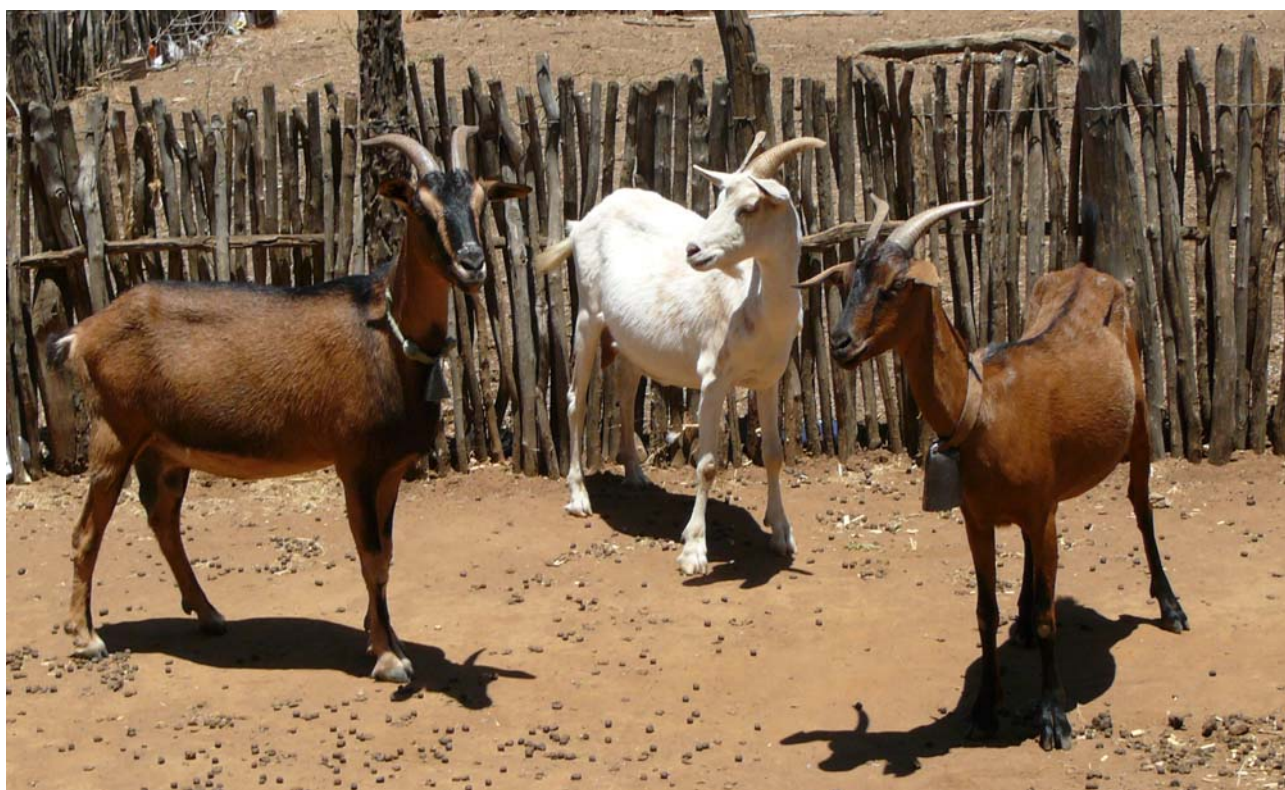
Cabras leiteiras do assentamento Moacir Lucena

liar não está se dando prioritariamente pela introdução de novos componentes, mas sim pela evolução de um agroecossistema que poderíamos chamar de tradicional. Observa-se que a criação de caprinos é o carro chefe da agricultura tradicional na região, mas em Moacir Lucena houve um conjunto de inovações nessa atividade que a potencializaram, tais como: o melhoramento genético do rebanho; mudanças na produção de ração, com a introdução da silagem e o feno; aprimoramento do manejo da caatinga, que permite aumentar a produção de forragem e, ao mesmo tempo, conservar a própria caatinga. Esta última inovação favoreceu ainda a difusão de uma atividade produtiva nova integrada à caatinga: a apicultura. Finalmente, com a implantação da unidade de beneficia-