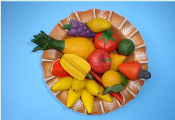
Artesanato do Jequitinhonha

ensina as comunidades rurais a não quererem beneficiar, com poucos recursos, um número muito grande de pessoas. Poucos recursos também facilitam a repartição de benefícios, desestimulam o controle pessoal do projeto, incentivam o grupo a se empenhar no sucesso da iniciativa e favorecem o debate de ideias sobre objetivos e alternativas porque todos os participantes dominam o assunto. Assim, as comunidades rurais agregam novos valores aos ganhos, os quais, acreditava-se, deveriam ser apenas quantitativos.