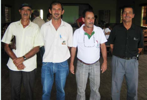
Reunião de dirigentes de organizações de agricultores do Alto Jequitinhonha