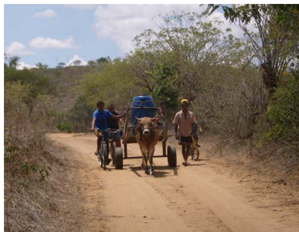
Forma tradicional de abastecimento de água

Também no acesso aos benefícios das políticas públicas as famílias mais pobres são penalizadas. Nas comunidades estudadas, a educação formal, a saúde pública e os serviços de transporte eram precários. A merenda escolar sofria longas interrupções. Não havia programas de saneamento básico na zona rural. A rede de energia elétrica passava ao lado das casas e as famílias também não dispunham de condições para o pagamento desse serviço. Embora constituíssem um importante aporte de renda para um número razoável de famílias, os programas sociais do governo existentes na época (Bolsa Renda, Bolsa Escola e Vale Gás) eram irregulares e sujeitos a desvio de finalidade em função de relações clientelistas, deixando à margem grande parte de seu público-alvo, justamente os mais pobres. As modalidades de crédito oficial tam-