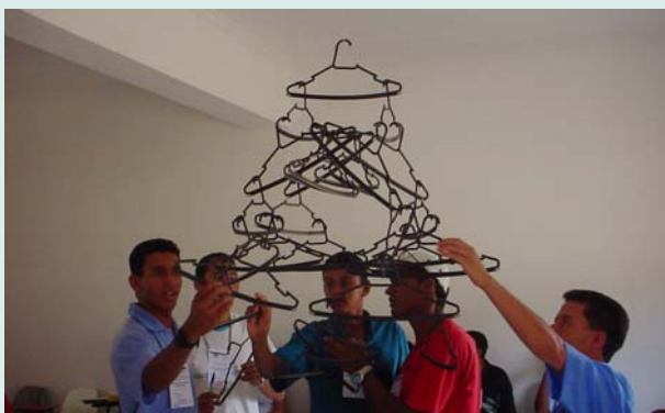
Capacitação de jovens agricultores da Associação Mineira de Escolas Família Agrícolas, Itaobim (MG)

Apesar de aparecem com grande frequência, esses problemas não estão exatamente relacionados ao caráter dos grupos, dos pequenos projetos, das organizações de mediação, nem da sua lógica própria de gerir os recursos. Os problemas com o sucesso econômico existem, mas são multiplicados pela perspectiva imposta pelo mercado e, às vezes, pela assessoria ao pequeno projeto econômico comunitário.