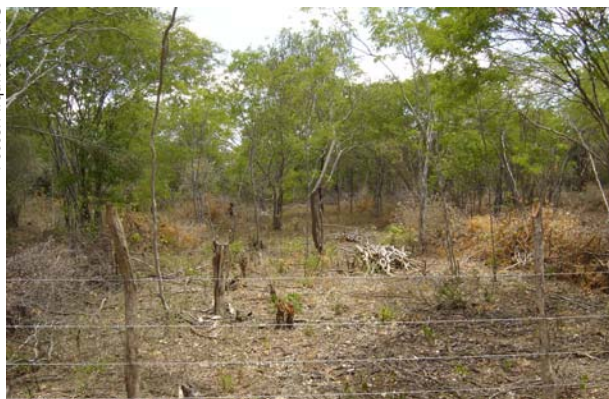
Parcela de manejo da caatinga de agricultor-experimentador