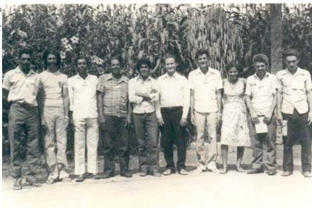
Reunião da CEB de Araponga em 1981

Depois da primeira compra em família, em 1977, a primeira compra coletiva foi realizada em 1989, envolvendo não só membros dos Lopes, mas outros meeiros e trabalhadores rurais. Assim, o que era história de família e acontecia com empréstimo de produtos, posteriormente se transformou em um fundo de crédito rotativo administrado pelo Sindicato de Trabalhadores Rurais de Araponga, que recebeu uma doação da Fundação Ford 3 para ser usada como capital de giro para a criação do fundo. A partir de então, o empréstimo passou a ser feito com um recibo do sindicato, com descrição da quantidade e o equivalente em arrobas de café. Ao pagar o empréstimo, o que pode ser feito em até dois anos, a pessoa ganha um recibo de quitamento da dívida.