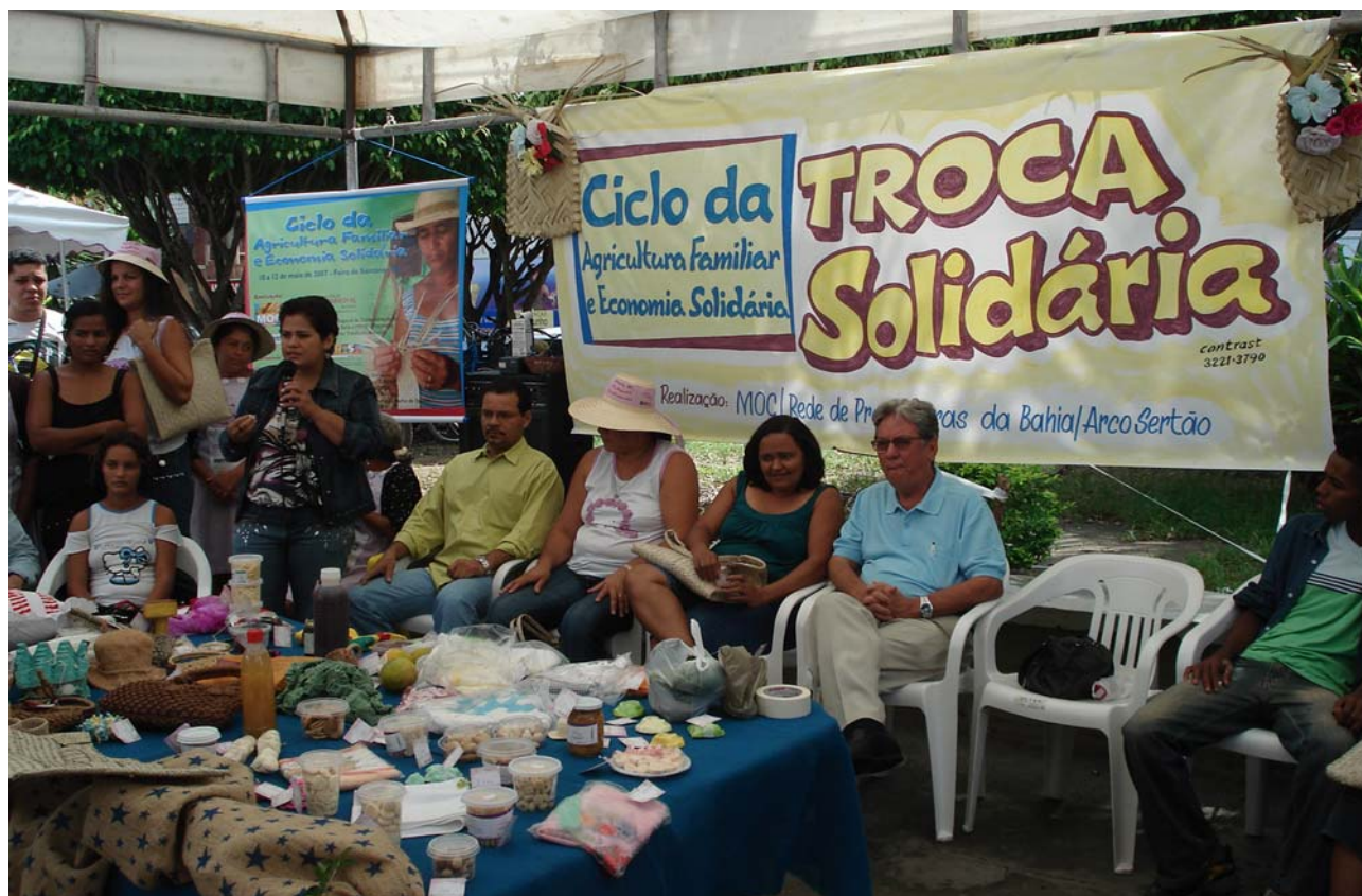
Feira de troca solidária

Apesar de a maior parte dos empreendimentos econômicos solidários já existirem há mais de três anos, ainda são diversos os desafios para a sua expansão e con-