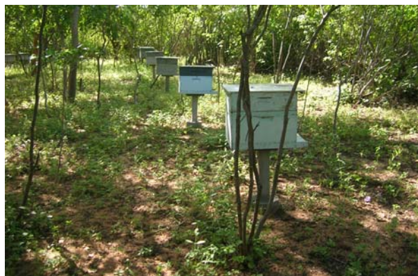
Apiário familiar dentro de uma área de caatinga manejada