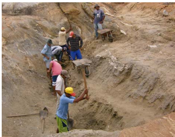
Mutirão para reforma de barreiro

Ao trazer à luz essas estratégias de sobrevivência, o estudo chamou a atenção para a necessidade de reorientar propostas e metodologias do programa de forma a potencializar as capacidades de iniciativa espontânea dos setores mais pobres para acessar e manejar recursos produtivos autonomamente. De fato, essa necessidade de reorientação estratégica foi confirmada pela análise dos impactos das ações anteriores do programa sobre a realidade dos mais pobres nas três co-