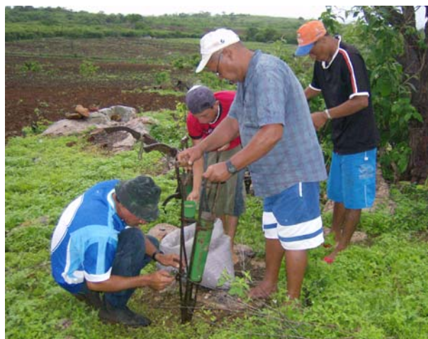
Mutirão para plantio de roçado