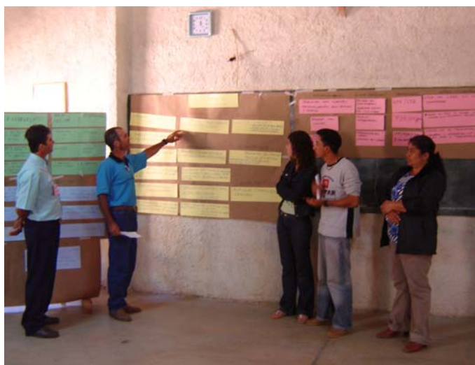
Elaboração do Plano de Ação de Espera Feliz

e, com base nelas, a execução de ações coerentes; o grande reconhecimento da organização local por parte de sua base social e o constante envolvimento de novas pessoas nos seus trabalhos; e a renovação dos quadros políticos das organizações, sem que a qualidade da intervenção seja reduzida.