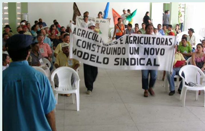
Mística de abertura do Seminário do Pólo da Borborema sobre movimento sindical

STRs, na catequese familiar, nas associações, etc.), vem favorecendo um maior equilíbrio do poder decisório entre gêneros, seja no âmbito do núcleo familiar ou na esfera pública, contribuindo para uma maior equidade e sustentação sociopolítica do processo de construção e promoção de um modelo de desenvolvimento para a região.