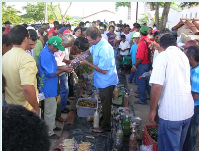
Feira de troca de produtos da agricultura familiar, em Arara