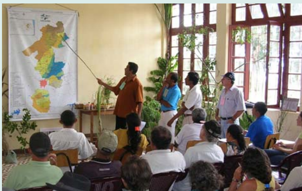
Foto maior: Encontro municipal em comemoração ao Dia Mundial da Água, em Massaranduba. Foto menor: Encontro da Agricultura Familiar do Pólo da Borborema

Além disso, um programa de formação em políticas públicas é direcionado à coordenação do Pólo e enfoca o conjunto das ações a partir de uma perspectiva mais abrangente, integrando os debates feitos nas comissões temáticas. A coordenação do Pólo é composta majoritariamente por lideranças também inseridas nas comissões temáticas, assegurando assim permanentes vínculos entre seus membros e as redes de experimentação agroecológica que se capilarizam na região.