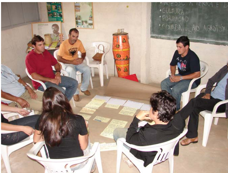
Participação comunitária na elaboração do plano de ação em Espera Feliz

No caso de Espera Feliz, as ações definidas no Plano de Ação estiveram centradas no campo da formação e promoção da Agroecologia, no planejamento da produção agroecológica para a comercialização coletiva, no cooperativismo e na valorização da cultura local.