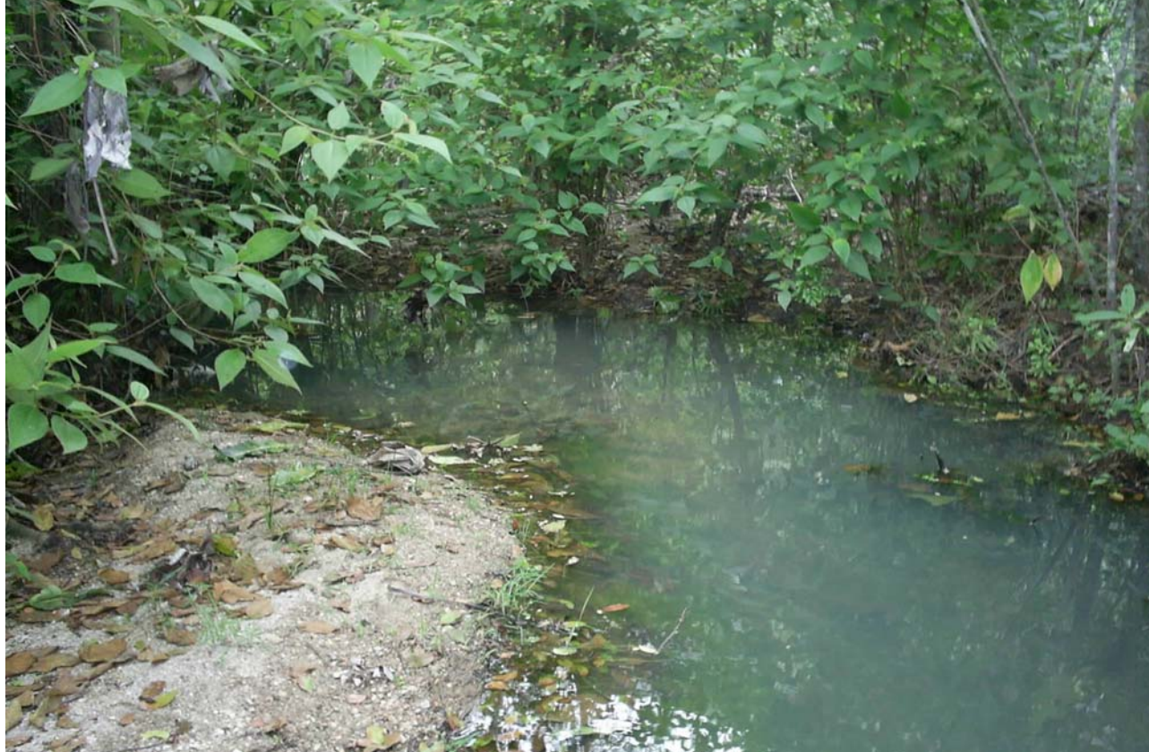
Nascente na comunidade de Tombo