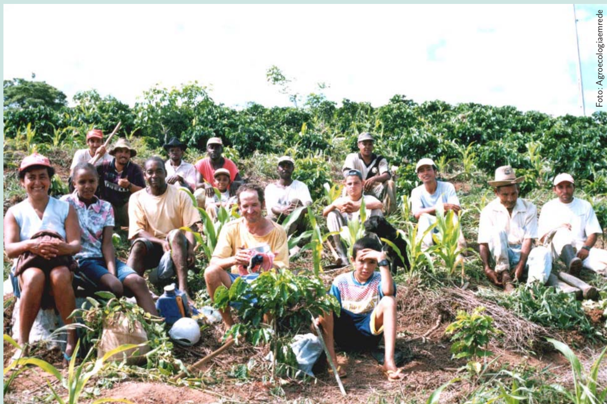
Mutirão em São Felipe, Espera Feliz