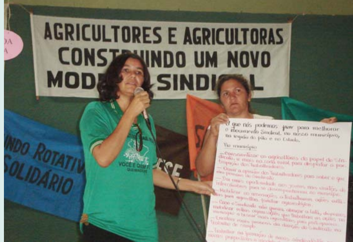
Seminário do Pólo da Borborema sobre movimento sindical

Nessa evolução, cabe destacar a participação das mulheres, tanto nos processos locais de experimentação, ao incorporarem temas de trabalho de interesse específico – como plantas medicinais ou ainda a água para o consumo da casa –, quanto na construção de um novo sujeito político. A valorização da presença feminina nas redes de inovação e de sua contribuição à economia familiar, bem como sua inserção nos espaços públicos (nos