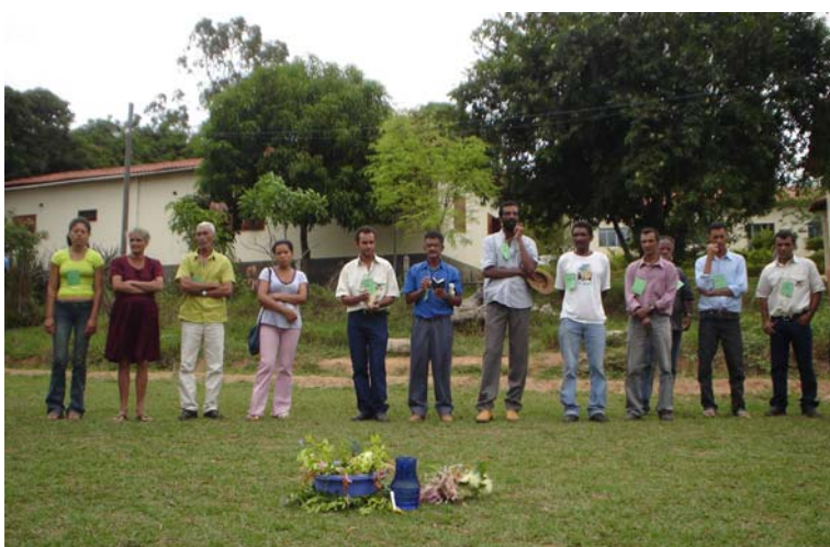
Celebração de monitores em área do CAV