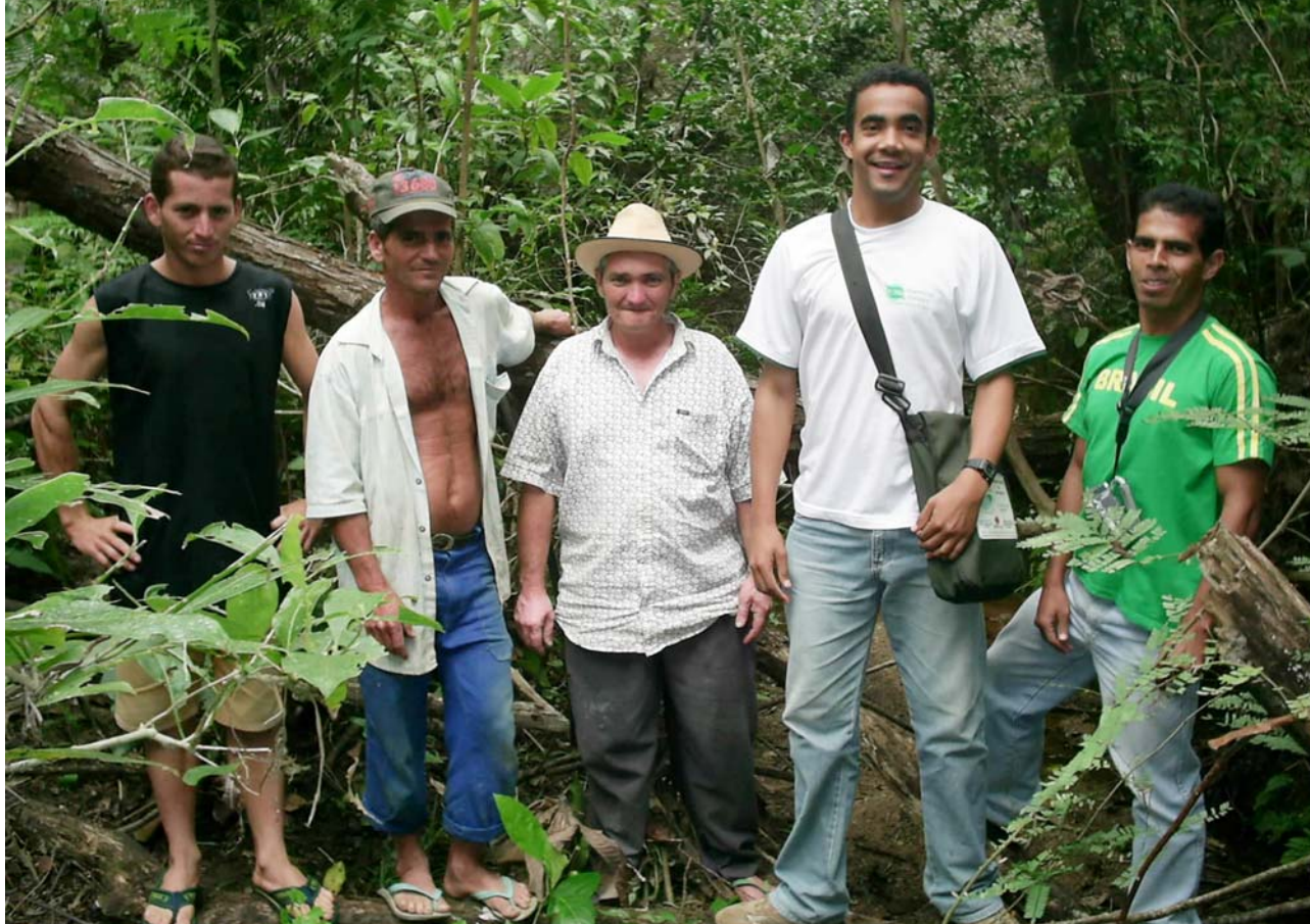
Entrevista da equipe de sistematização com agricultores de Medina

Entre os temas enfocados estavam o acesso à educação, à terra, à água e ao crédito; a situação da documentação das famílias; as condições sanitárias e tipos de moradia; a disponibilidade de energia; a participação em organizações; e o envolvimento na experiência de gestão e conservação de nascentes. Essa foi também uma oportunidade para quantificar o número de famílias nas comunidades e atualizar a leitura sobre seus sistemas de produção. O diagnóstico foi realizado com uma amostra de aproximadamente 30% das pessoas de 29 comunidades rurais.