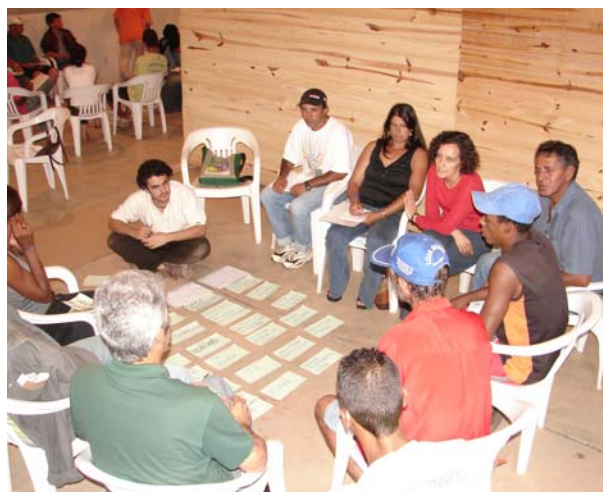
Representantes das comunidades durante encontro de planejamento em Espera Feliz.

O plano de ação orienta e articula as estratégias das organizações locais para o DL. Os temas tratados são abrangentes, fruto das reflexões nas comunidades motivadas pelo diagnóstico. As perspectivas para a juventude rural e os cuidados com o meio ambiente são exemplos de questões enfocadas nesses processos. No entanto, as propostas e ações planejadas terminam se restringindo àquelas que estão dentro do campo da governabilidade das organizações envolvidas.