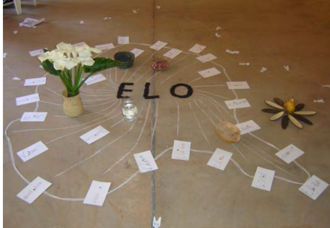
Mística de abertura dos encontros de planejamento

E é por isso que o fortalecimento das organizações sociais locais figura como um objetivo central nos processos de (des)envolvimento local. Podemos relacionar alguns indicadores alcançados nesse sentido: a capacidade de diferenciação de papéis entre as organizações sociais; o estabelecimento de um conjunto de estratégias