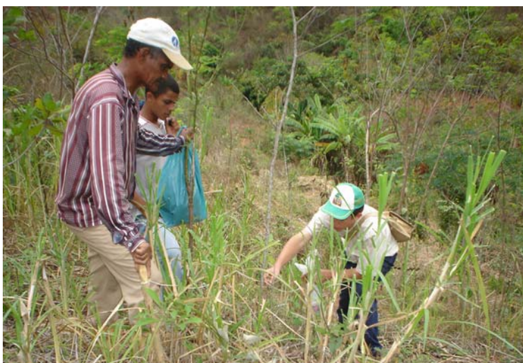
Coleta de amostras de solo em área de monitor do CAV, em Chapada do Norte

Apesar disso, no Alto Jequitinhonha, esse sistema foi compreendido pelos agricultores como um complemento e aperfeiçoamento dos seus sistemas de produção costumeiros por pousio e das lavouras de