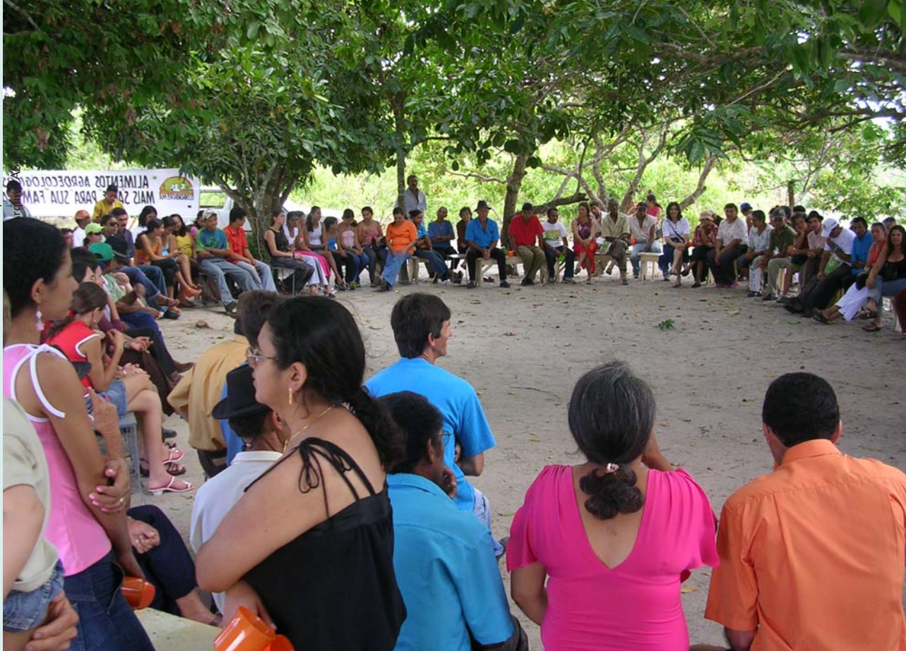
Assembléia de constituição da Ecoborborema, em Alagoa Nova