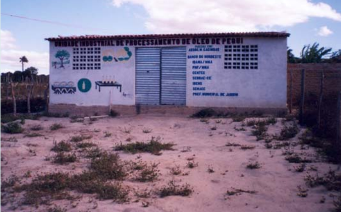
Fábrica de processamento de óleo de piqui, Cacimbas