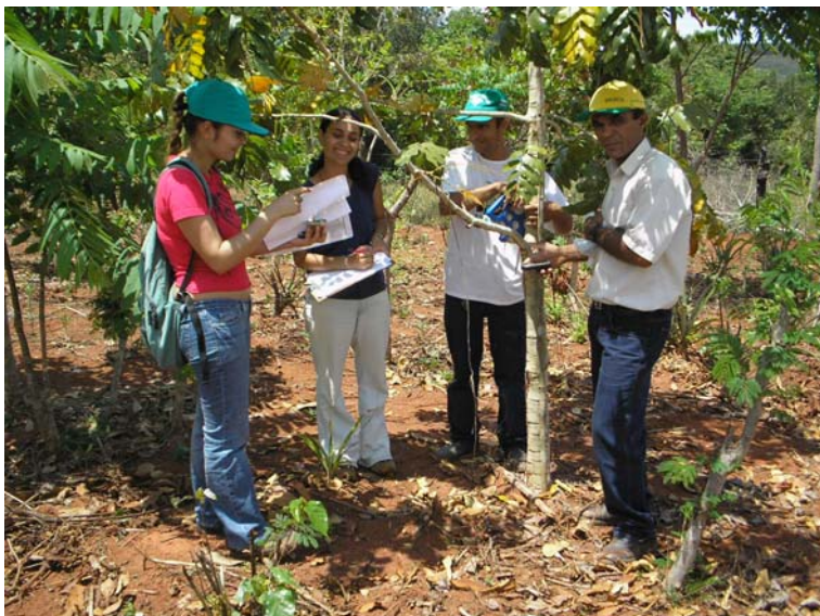
Técnicos do CAV identificando espécies florestais em área de agrosilvicultura