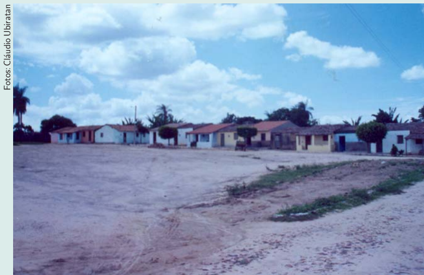
Visão geral da comunidade de Cacimbas