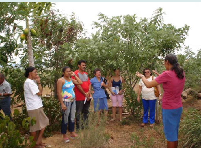
Visita de intercâmbio de experiências em saúde e alimentação, em Solânea

As experiências bem-sucedidas realizadas na região e monitoradas por essas comissões temáticas são analisadas e contrastadas com as propostas para o desenvolvimento da agricultura propugnadas pelos diferentes instrumentos e operadores de políticas públicas, como as de extensão rural, de crédito, de pesquisa agrícola, e os programas de distribuição de sementes, dentre outros. Com base nesse enfoque comparativo, o debate sobre modelos de desenvolvimento ganhou maior nitidez. Dessa forma, pouco a pouco, as redes de agricultores-experimentadores articuladas pelo Pólo se constituíram também como espaços de debate e ação política em defesa de um projeto próprio para o desenvolvimento do território.