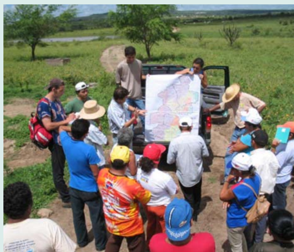
Diagnóstico Ambiental do Pólo da Borborema, em Remígio

Coordenadas pelos próprios STRs e animadas pelos agricultores-experimentadores, uma grande multiplicidade de práticas agroecológicas se disseminaram nos sistemas produtivos da região. Ao mesmo tempo, vão se estruturando diversas expressões coletivas de promoção do desenvolvimento da agricultura familiar nas comunidades. Inovações sócio-organizativas de gestão de recursos, como os Bancos de Sementes e os Fundos Rotativos Solidários, dão suporte aos processos comunitários de inovação, viabilizando o acesso a sementes, mudas, esterco, cercas de tela, cisternas de placa e outras infra-estruturas hídricas. Agricultores e agricultoras passaram também a ter uma participação mais ativa na vida das comunidades, discutindo e refletindo sobre a realidade da agricultura familiar, as formas de superação de seus problemas, assim como participando da gestão de recursos coletivos.